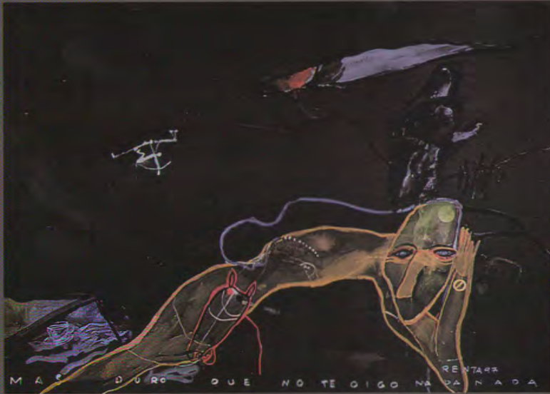
( más duro que no te oigo acuarela sobre papel 16,5 x 29,5 )