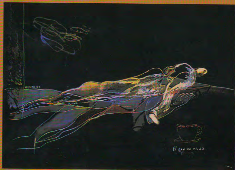
el que no vuela acuarela sobre papel 16.5 x 29.5