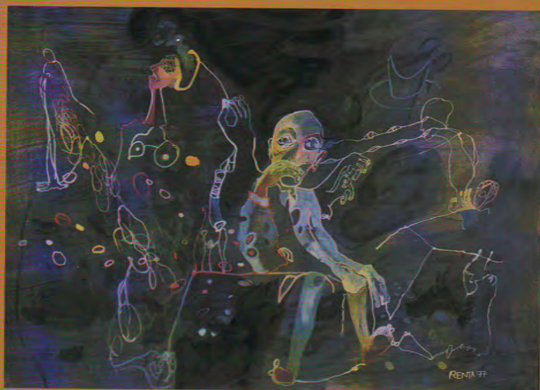
al séptimo año acuarela sobre papel 22.5 x 30