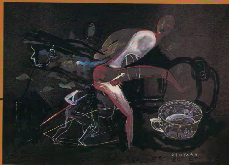
dramas de la vida real etc. acuarela sobre papel 16.5 x 29.5